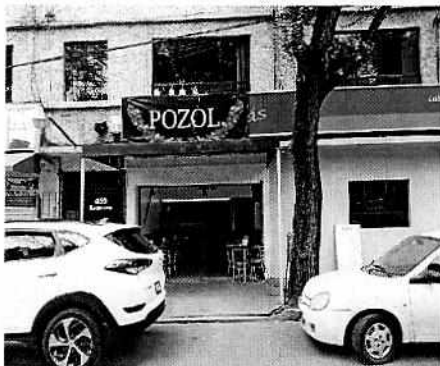
Se muestra el establecimiento denunciado.

En ese sentido, personal de esta Subprocuraduría llevó a cabo una visita de reconocimiento de hechos, de acuerdo a lo establecido en el artículo 15 BIS 4 fracción IV de la Ley Orgánica de esta Entidad, diligencia de la cual se levantó el acta circunstanciada correspondiente, haciendo constar que desde la vía pública se constató la operación de una bocina que reproducía música grabada, la cual se ubicaba en la colindancia del local comercial denunciado y la banqueta, por lo que en la misma diligencia mediante estudio técnico se acreditó que el establecimiento denunciado generaba un nivel sonoro desde el punto de denuncia de 67.56 dB(A), valor que excedía los límites máximos permisibles establecidos en la Norma Ambiental NADF-005-AMBT-2013.