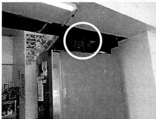
Se muestra la bocina al interior del establecimiento denunciado

No. de Folio: PAOT-05-300/200-13322-2019