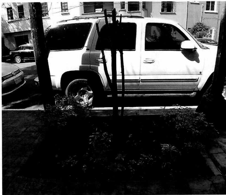
Fotografía 1. Vista del árbol motivo de denuncia.

En este sentido, personal de esta Subprocuraduría realizó visita reconocimientos de hechos de acuerdo a lo establecido en el artículo 15 BIS 4 fracción IV de la Ley Orgánica de esta Entidad, diligencia durante la cual se constató la presencia de un tocón presumiblemente de un árbol de la especie conocida comúnmente como laurel, el cual evidenciaba haber sido producto de derribo reciente, toda vez que se observó coloración clara de la albura, así como nulo desgaste de la madera expuesta. Al respecto, al momento de la visita se hizo entrega del citatorio correspondiente a la persona señalada como responsable de la afectación del árbol, quien, de acuerdo a su dicho, sólo había solicitado su poda.