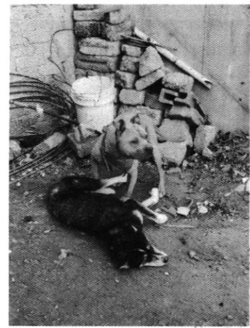
Fotografías 1-3. Ejemplares caninos, motivo de denuncia y sin un sitio de alojamiento.