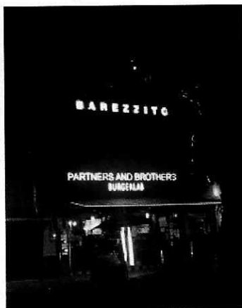
Fotografía 1. Vista de la fachada del establecimiento.

Las denuncias se refieren a las emisiones sonoras generadas por las actividades del establecimiento con denominación comercial “Barezzito”, ubicado en avenida Oaxaca número 79, planta alta, colonia Roma Norte, Alcaldía de Cuauhtémoc, por lo que en atención a las mismas, personal de esta Subprocuraduría llevó a cabo tres visitas de reconocimiento de hechos, establecido en el artículo 15 BIS 4 fracción IV de la Ley Orgánica de esta Entidad, diligencias durante las cuales, se constató que en la planta baja existe otro establecimiento denominado “Partnes and Brothers Burgerlab”, constatándose emisión sonora de música grabada que es perceptible desde la vía pública; por lo que ambos constituyen una fuente de ruido de acuerdo a lo señalado en la Norma Ambiental NADF-005-AMBT-2013, que establece las condiciones de medición y los límites máximos permisibles de emisiones sonoras de aquellas actividades o giros que para su funcionamiento utilicen maquinaria, equipos, artefactos o instalaciones que generen emisiones sonoras al ambiente.