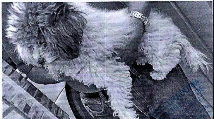
Fotografía 1. Se muestra ejemplar canino ubicado en el domicilio señalado en el escrito de denuncia.

Medellín 202, piso 4, colonia Roma Norte Alcaldía Cuauhtémoc, C.P. 06700, Ciudad de México Tel. 5265 0780 ext 12011 y 12400