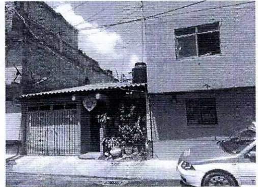
Fotografía 1. Fachada del predio señalado como lugar de los hechos.

En este sentido, de las constancias que obran en el presente expediente, se desprende que personal de esta Subprocuraduría llevó a cabo una visita de reconocimiento de hechos, de acuerdo a lo establecido en el artículo 15 BIS 4 fracción IV de la Ley Orgánica de esta Entidad, diligencia durante la cual una persona habitante del lugar donde se denunciaron los hechos objeto de la presente investigación, hizo de conocimiento al personal adscrito a esta Subprocuraduría que en el inmueble de referencia no se encuentran ejemplares caninos, toda vez que la persona arrendataria no permite que los inquilinos tengan animales de compañía; de igual manera, tampoco se percibieron ladridos u olores provenientes del interior del domicilio en cuestión.