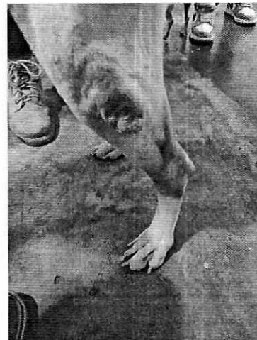
Figura 1y 2. Ejemplar denunciado.