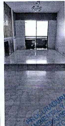
Fotografías 1 y 2. Se muestra parte del interior y patio del domicilio.