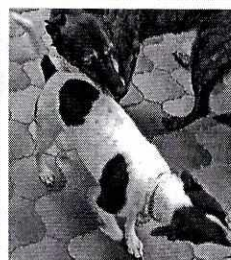
Fotografías 3 a 9. Se muestran los ejemplares caninos.

Al respecto, se concluye que el predio ubicado en calle Progreso número 05, colonia Barrio de San Lucas, Alcaldía Coyoacán, corresponde a una casa habitación.