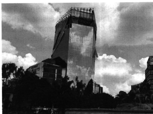
Rec. de Hechos de fecha 21 de octubre de 2019