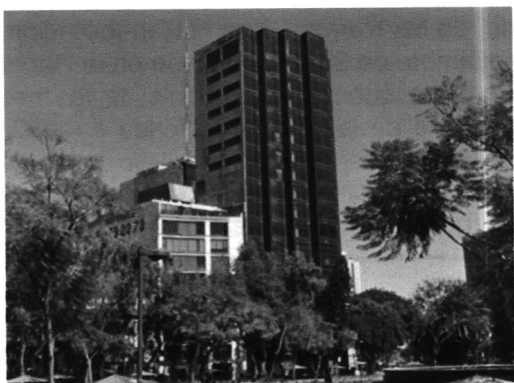
Google Maps Street View - enero de 2017

Aunado a lo anterior, personal adscrito a esta Subprocuraduría, de conformidad con los artículos 21 y 25 fracción VIII de la Ley Orgánica de esta Entidad, y 56 antepenúltimo párrafo de la Ley de Procedimiento Administrativo de la Ciudad de México, de aplicación supletoria, a efecto de allegarse y desahogar todo tipo de elementos probatorios para el mejor conocimiento de los hechos sin más limitantes que las señaladas en la Ley de Procedimiento Administrativo de la Ciudad de México, siendo que en los procedimientos administrativos se admitirán toda clase de pruebas, excepto la confesional a cargo de la autoridad y las que sean contrarias a la moral, al derecho o las buenas costumbres; en fecha 24 de abril de 2019, realizó la consulta al Sistema de Información Geográfica Google Maps, vía Internet ( http://www.google.com/earth/ ), y con ayuda de la herramienta Street View, en la cual se localizaron imágenes aéreas y a pie de calle, se advirtió la ampliación de todos los niveles del inmueble investigado en los frentes colindantes a Plaza Villa Madrid, Avenida Oaxaca y en su sección posterior. Acta circunstanciada que tiene el carácter de documental pública y que se valora en términos de los artículos 327 fracción II y 402 del Código de Procedimientos Civiles para la Ciudad de México y 30 BIS de la Ley Orgánica de la Procuraduría Ambiental y del Ordenamiento Territorial de la Ciudad de México.