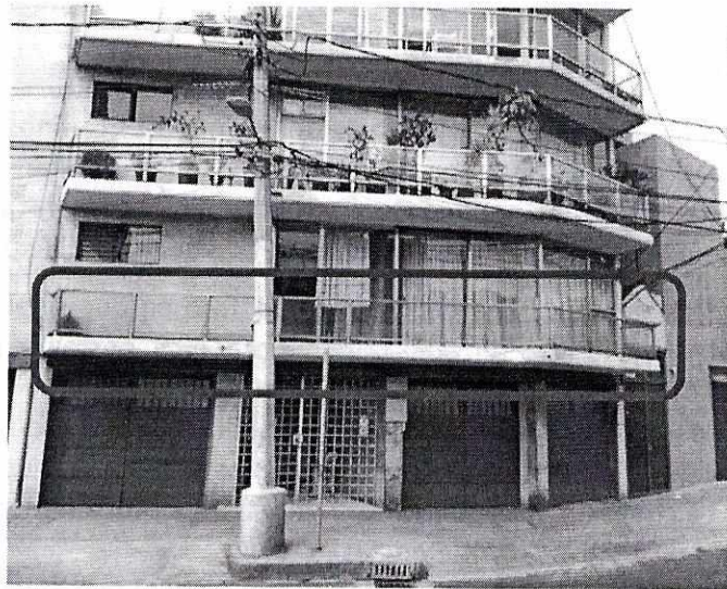
Fotografías 3 y 4. Se muestra la presencia de recipientes con alimento y agua limpia para consumo de los animales; asimismo, se resalta el sitio de alojamiento de los cánidos visto desde la vía pública.

En seguimiento de lo anterior, personal de esta Subprocuraduría llevó a cabo una nueva visita de reconocimiento de hechos con la finalidad de dar seguimiento a la presente investigación, constatando que la persona encargada del cuidado de los caninos realizó la recomendación realizada por personal de esta Entidad.