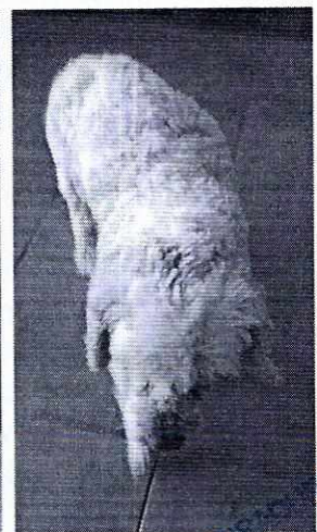
Fotografías 1 y 2. Se muestra condición de los ejemplares caninos en comento.