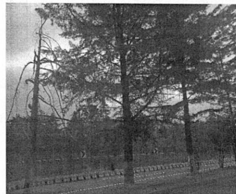
Imagen de fecha 08 de febrero de 2022