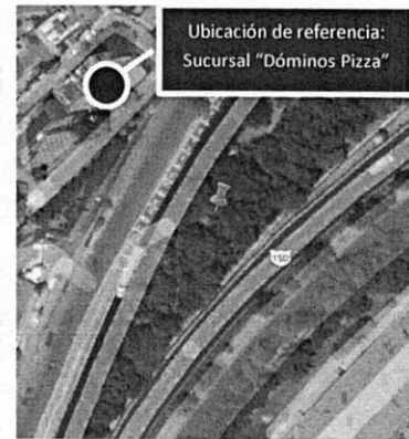
Ubicación de referencia: Sucursal "Dóminos Pizza"