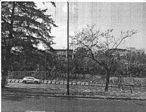
Imagen de fecha 15 de marzo de 2022