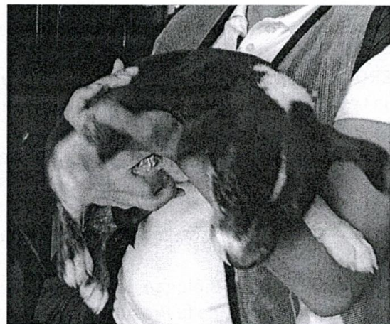
Imagen 2. Se observa a ejemplar canino de nombre Oswal.

En virtud de lo antes expuesto, esta Entidad considera procedente emitir la presente resolución, de conformidad con el artículo 27 fracción VI de la Ley Orgánica de esta Procuraduría, por imposibilidad legal, al no constatar irregularidades en materia de bienestar animal.