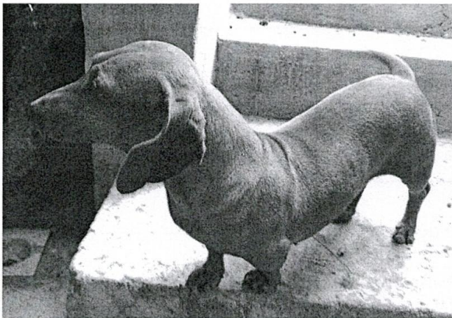
Imagen 3. Se observa a ejemplar canino de nombre Choris.