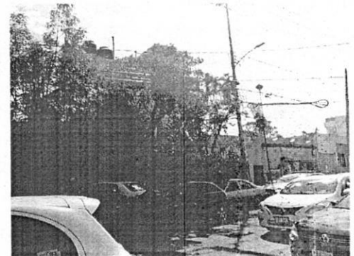
Fuente: Imagen obtenida en el reconocimiento de hechos 18 de noviembre de 2021

En consecuencia, se actualiza el supuesto previsto en el artículo 27 fracción VI de la Ley Orgánica de la Procuraduría Ambiental y del Ordenamiento Territorial de la Ciudad de México al existir imposibilidad material para continuar con la investigación, toda vez que no se constataron los hechos denunciados consistentes en actividades de ampliación. -----