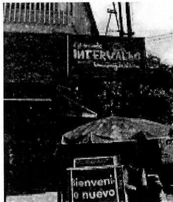
Fotografía 1 Fachada del establecimiento motivo de denuncia.

En virtud de lo antes expuesto, esta Entidad considera procedente emitir la presente resolución de conformidad con el artículo 27 fracción VII de la Ley Orgánica de esta Procuraduría, por la implementación de las medidas tendientes a reducir el impacto de las emisiones sonoras por parte del establecimiento motivo de denuncia, lo anterior, mediante la promoción del cumplimiento voluntario de las disposiciones en materia ambiental, contenido en el artículo 5 fracción XIX de la Ley Orgánica de esta Procuraduría.