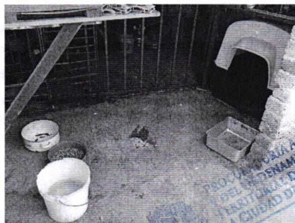
Figuras 4 y 5. Vista del ejemplar canino motivo de denuncia.