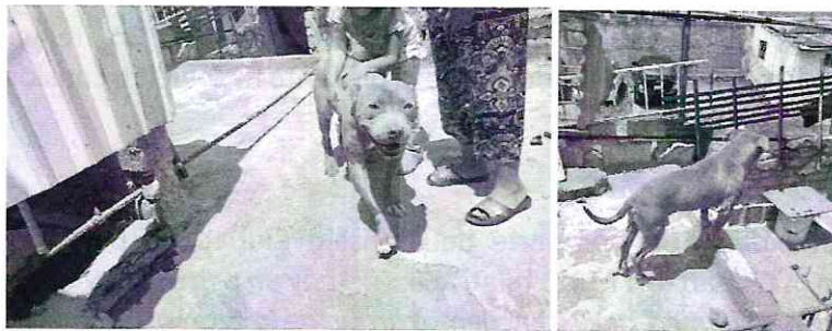
Fotografías.- vista del ejemplar canino que habita en el inmueble motivo de denuncia

En este sentido, mediante correo electrónico, la responsable del animal de compañía que nos ocupa, envió evidencia fotográfica donde se observó un canino de la raza pitbull, color café, que deambula libremente, con condición corporal acorde a su talla y raza, el cual se observó que cuenta con un lugar de resguardo y recipientes con agua y alimento.