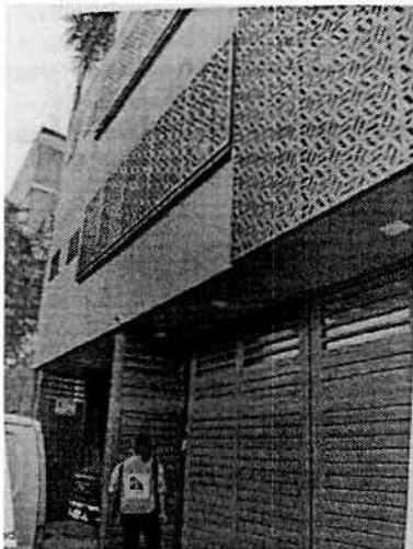
Imagen 1. Se observa personal de esta Entidad.

En este sentido, de las constancias que obran en el presente expediente, se desprende que personal de esta Subprocuraduría llevó a cabo una visita de reconocimiento de hechos, de acuerdo a lo establecido en el artículo 15 BIS 4 fracción IV de la Ley Orgánica de esta Entidad, diligencia durante la cual una persona trabajadora del lugar indicado por la persona denunciante, hizo de conocimiento del personal adscrito a esta Subprocuraduría, que en el sitio no se cuenta con animales de compañía, toda vez que, el inmueble es un taller, hechos que fueron constatados por el personal actuante desde la vía pública.