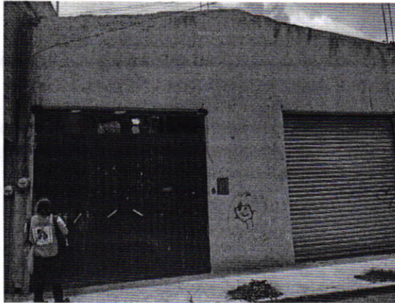
Figura 1. Lugar de los hechos denunciados.

En este sentido, de las constancias que obran en el presente expediente, se desprende que personal de esta Procuraduría llevó a cabo una visita de reconocimiento de hechos, de acuerdo a lo establecido en el artículo 15 BIS 4 fracción IV de la Ley Orgánica de esta Entidad, diligencia durante la cual una persona habitante del lugar donde se denunciaron los hechos objeto de la presente investigación, hizo de conocimiento al personal adscrito a esta Subprocuraduría que el ejemplar canino que fue señalado en el escrito de la denuncia, ya no se encuentra en el inmueble, lo anterior toda vez que desde hace aproximadamente cuatro meses la persona que habitaba dicha vivienda dejó de arrendar la misma, llevándose consigo a su animal de compañía. Cabe señalar que el personal de la PAOT constató que efectivamente no había algún ejemplar con las características descritas en la denuncia al exterior del domicilio en cuestión.