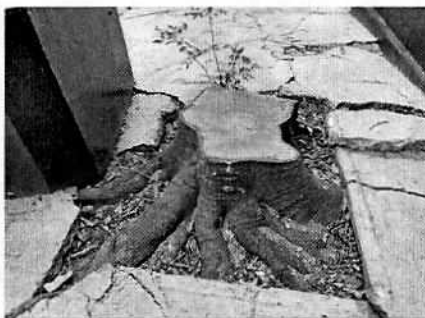
Figuras 1-2. Vista de los dos tocones encontrados frente al centro religioso.