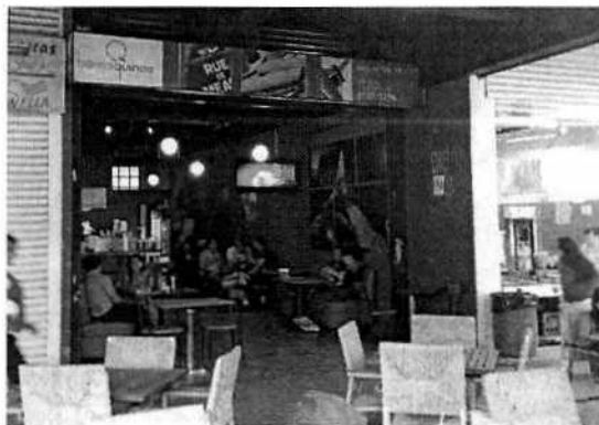
Figura 1. Vista del establecimiento motivo de denuncia.

entrevistaron con una persona del local contiguo, quien manifestó que el establecimiento en mención, no había abierto desde hacía más de una semana.