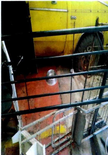
Fotografía 1.-Se observa su alojamiento del canino.

En seguimiento a la denuncia, el propietario del canino tuvo comunicación con personal de esta Procuraduría, quien mediante aplicación móvil inteligente mando imágenes fotográficas y vídeos donde muestra al ejemplar canino libre en un espacio enrejado y techado, cuenta con un recipiente con agua y a decir de la propietaria al canino se le proporciona alimento consistente en croquetas 2 veces al día.