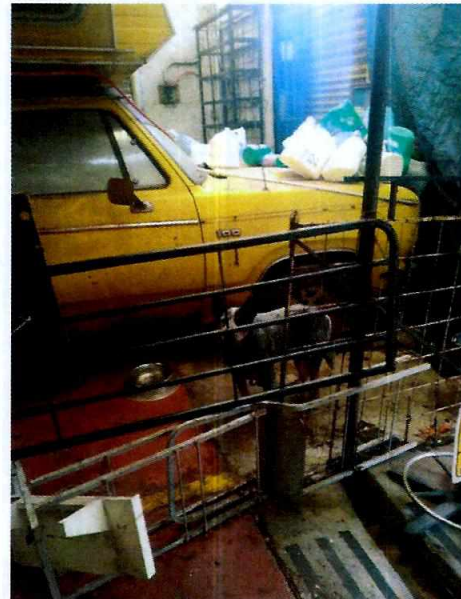
Fotografía 2.- Se observa el canino motivo de denuncia.

Es de resaltar que, en el Acuerdo de Admisión, que fue enviado por correo electrónico a la persona denunciante se le hizo de conocimiento que contaba con un término de seis días hábiles para aportar las pruebas que estimara pertinentes en la investigación de los hechos, lo anterior conforme al artículo 90 del Reglamento de la Ley Orgánica de la Procuraduría Ambiental y del Ordenamiento Territorial de la Ciudad de México; sin embargo durante el procedimiento de investigación, no fueron proporcionados elementos de prueba que pudieran determinar incumplimiento a la normatividad en materia de bienestar animal.