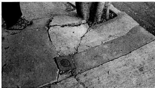
Fotografías 1 y 2. Vista del árbol motivo de denuncia y afectación causada por el crecimiento radicular.

En ese sentido, se cuenta con elementos para señalar que se han atendido los requisitos estipulados en el artículo 118 de la Ley Ambiental de Protección a la Tierra en el Distrito Federal, la autoridad competente ha dictaminado y determinado que el árbol se encuentra causando afectaciones significativas en la infraestructura del lugar y pone en riesgo los bienes de las personas, por lo que la Dirección General de Servicios Urbanos de la Alcaldía de Tlalpan deberá informar a esta Entidad sobre el manejo que se dará al sujeto arbóreo, el cual de acuerdo a las constancias que obran en el expediente de mérito, no ha sido intervenido.