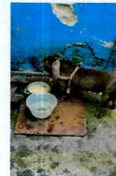
Fotografía 2.- Se aprecia al canino con comida y agua.

En seguimiento a la denuncia, personal de esta Subprocuraduría tuvo comunicación vía telefónica con la persona denunciante quien indicó que el canino ya no se encuentra en dicho domicilio, por lo que los hechos que motivaron su denuncia dejaron de existir.