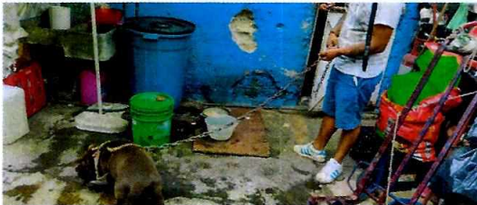
Fotografía 1.- Se aprecia que el canino no cuenta con un sitio que lo proteja con la intemperie.