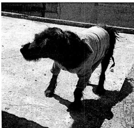
Fotografía 1. Ejemplar canino motivo de denuncia

PROCURADURÍA AMBIENTAL Y DE ORDENAMIENTO TERRITORIAL DE LA CDMX