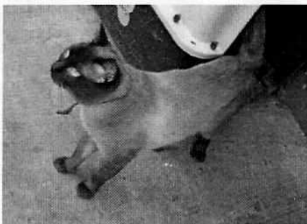
Fotografía 1-2. Vista del ejemplar felino.