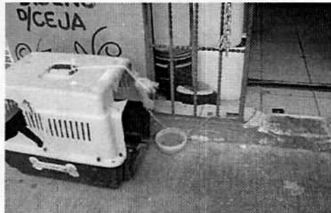
Fotografía 3-4. Se muestra el alimento, así como la transportadora donde el gato es resguardado cuando hay clientes presentes en el establecimiento.