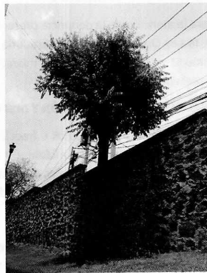
Imagen 2. Individuo arbóreo localizado.