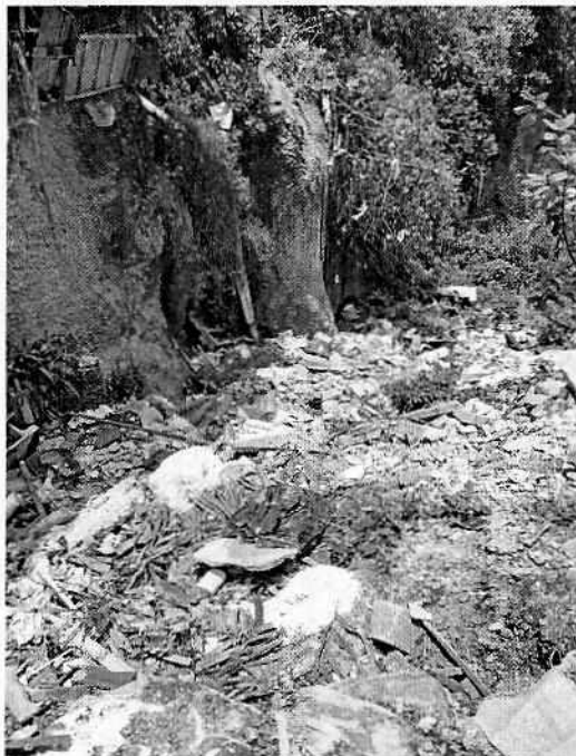
Fotografía 1. Vista desde la calle 29, en donde se observa la acumulación de residuos hacia el interior de la barranca.

En este sentido, personal de esta Subprocuraduría realizó dos visitas de reconocimiento de hechos de acuerdo a lo establecido en el artículo 15 BIS 4 fracción IV de la Ley Orgánica de esta Entidad, diligencias durante las cuales se constató que, desde la parte alta de la barranca, en la calle 29 de la colonia Olivar del Conde 2da sección, son arrojados residuos sólidos urbanos, mimos que se han desbordado hacia el interior de la barranca.