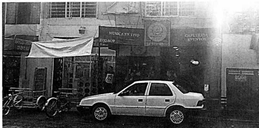
Fotografía 1. Vista exterior del establecimiento motivo de denuncia.

En este sentido, personal de esta Subprocuraduría realizó visita de reconocimientos de hechos de acuerdo a lo establecido en el artículo 15 BIS 4 fracción IV de la Ley Orgánica de esta Entidad, durante la cual se constató el funcionamiento del establecimiento con denominación comercial "Sol y Luna Café", el cual, de acuerdo a la consulta realizada por personal de esta Entidad en el Sistema de Información Geográfica de la Secretaría de Desarrollo Urbano y Vivienda de la Ciudad de México, se desprendió que al predio de mérito le aplica una zonificación Habitacional, en el cual el uso de suelo para video bares, bares y restaurante con venta de bebidas alcohólicas se encuentra prohibido.