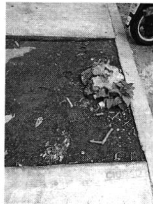
Se muestran los tocones encontrados en el sitio.

Medellín 202, 4to piso, colonia Roma Norte Alcaldía Cuauhtémoc, C.P. 06700, Ciudad de México Tel. 5265 0780 ext 12011 ó 12400