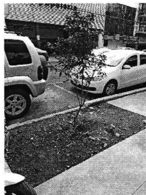
Se muestran los árboles plantados como compensación.

En virtud de lo anterior y toda vez que se llevó a cabo la plantación de dos árboles por parte de la Alcaldía Cuauhtémoc y el gimnasio denominado "Roma Club" como compensación por los derribos motivo de la denuncia, ésta Procuraduría considera procedente dar por concluida la investigación de conformidad con el artículo 27 fracción III de la Ley Orgánica de esta Procuraduría.