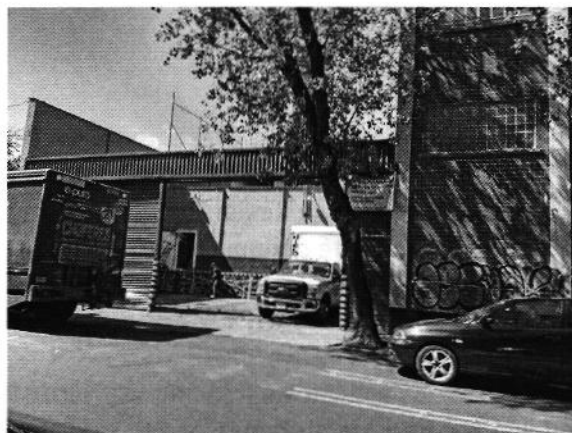
Imágenes 1 y 2. Se observa establecimiento motivo de investigación

En relación con lo anterior, se notificó citatorio PAOT-05-300/210-1403-2019, a fin de que la persona propietaria, encargada y/o representante legal del establecimiento de mérito se presentara a comparecer, en las oficinas que ocupa esta Procuraduría, por lo que compareció ante esta Entidad, el representante legal del establecimiento denunciado; sin embargo no presentó ningún documento que demostrara el cumplimiento a la legislación en materia de uso de suelo.