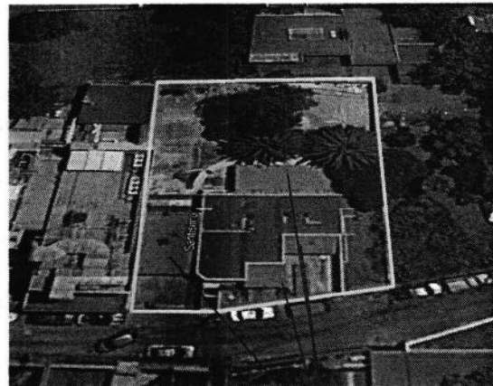
Cuerpos constructivos de reciente

Imagen 1 y 2. Vista aérea del predio objeto de investigación, en el cual se advierte que se realizaron intervenciones