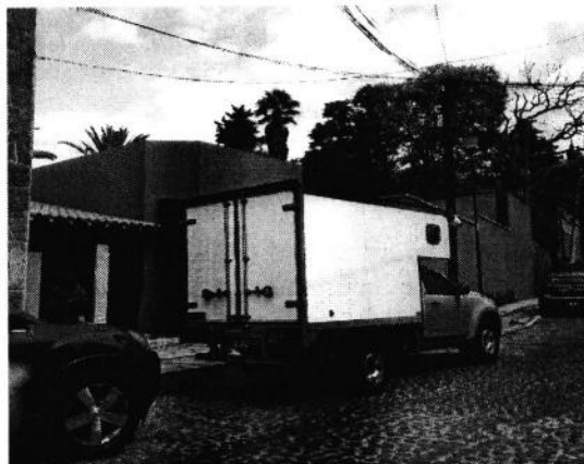
Imagen 3 y 4. Vista de la fachada del Inmueble.