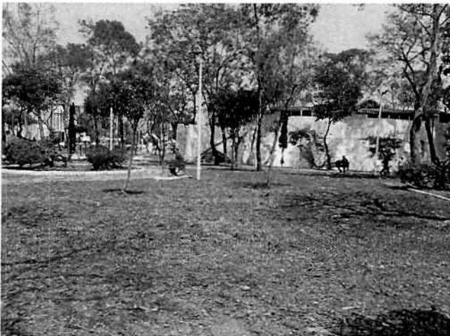
Fotografías 1 y 2. Se muestra sitio motivo señalado como lugar de los hechos.

En este sentido, personal de esta Subprocuraduría realizó visita reconocimiento de hechos de acuerdo a lo establecido en el artículo 15 BIS 4 fracción IV de la Ley Orgánica de esta Entidad, diligencia durante la cual se constató la poda y derribo de diversos individuos arbóreos al interior del espacio público señalado por las personas denunciantes.