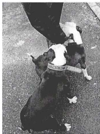
Imagen 1 y 2. Ejemplares caninos motivo de denuncia llamado "Cocoa", "Canica" y "Rataouille"