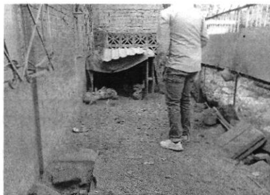
Imagen 1.- Ejemplares animales motivo de denuncia.

pato y un gallo, ubicados en el sitio referido, al respecto los ejemplares presentaban una buena condición corporal y su sitio de alojamiento se encontró limpio.