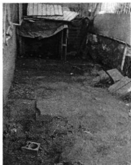
Imagen 3.- Sitio donde se encontraban los ejemplares.

En virtud de lo señalado, se da por concluida la investigación de conformidad con el artículo 27 fracción VII de la Ley Orgánica de esta Procuraduría.