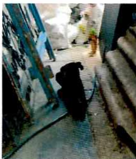
Fotografía 4-. Ejemplar canino del inmueble.

En seguimiento de lo anterior, personal de esta Subprocuraduría llevó a cabo un tercer reconocimiento de hechos con la finalidad de dar seguimiento a las recomendaciones antes mencionadas; sin embargo, el propietario refirió que los caninos de la visita anterior fueron envenenados por vecinos del lugar, por lo que ya no se encuentran en el lugar, derivado de lo anterior adoptó a un ejemplar canino, el cual fue evaluado constatando que contaba con bienestar animal en cuanto a condición corporal y muscular, alojamiento, alimento y agua brindada, comportamiento y condición de salud.