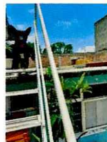
Fotografías 1-3. Caninos motivo de denuncia.

En seguimiento de lo anterior, personal de esta Subprocuraduría llevó a cabo un tercer reconocimiento de hechos con la finalidad de dar seguimiento a las recomendaciones antes mencionadas; sin embargo, el propietario refirió que los caninos de la visita anterior fueron envenenados por vecinos del lugar, por lo que ya no se encuentran en el lugar, derivado de lo anterior adoptó a un ejemplar canino, el cual fue evaluado constatando que contaba con bienestar animal en cuanto a condición corporal y muscular, alojamiento, alimento y agua brindada, comportamiento y condición de salud.