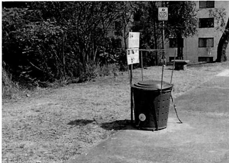
Fotografía 2. Se observa la nueva ubicación del compostero, así como el retiro de la plancha de cemento.

En seguimiento a lo anterior, personal adscrito a esta Entidad llevó a cabo nueva visita de reconocimiento de hechos, diligencia durante la cual se constató el cumplimiento del compromiso voluntario adquirido por el responsable de la instalación de los composteros; además, en el mismo acto no fueron observadas afectaciones a otras áreas verdes al interior de la unidad habitacional, con motivo de la acciones denunciadas.