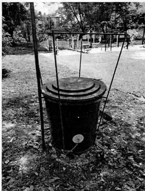
Fotografía 1. Vista del compostero colocado en el área verde motivo de denuncia.

En este sentido, personal de esta Subprocuraduría realizó visita reconocimientos de hechos de acuerdo a lo establecido en el artículo 15 BIS 4 fracción IV de la Ley Orgánica de esta Entidad, diligencia durante la cual se constató la que, dentro del jardín ubicado en el área común de la explanada del edificio H-7 de la U.H. Lomas de Plateros, se instaló un contenedor de plástico adherido al suelo con una capa de cemento, por lo que existía contravención a lo estipulado en la Ley Ambiental de Protección a la Tierra en el Distrito Federal; al respecto, durante la citada diligencia se hizo entrega del citatorio correspondiente a la persona señalada como responsable de los hechos denunciados.