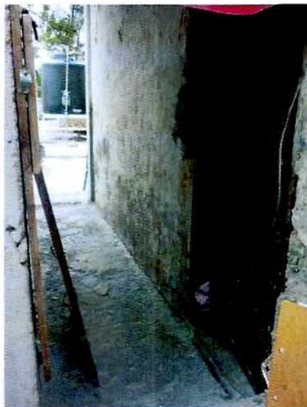
Fotografías 1 y 2. Lugar de los hechos denunciados.

En virtud de lo antes expuesto, esta Entidad considera procedente emitir la presente resolución, de conformidad con el artículo 27 fracción VI de la Ley Orgánica de esta Procuraduría, por imposibilidad material en virtud de que dejaron de existir los hechos denunciados, al ya no encontrarse los ejemplares caninos en el lugar de la denuncia.