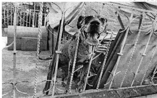
Imágenes 1-2.- Caninos objeto de investigación, (izquierda) "Luna" y (derecha) "Cuquis".