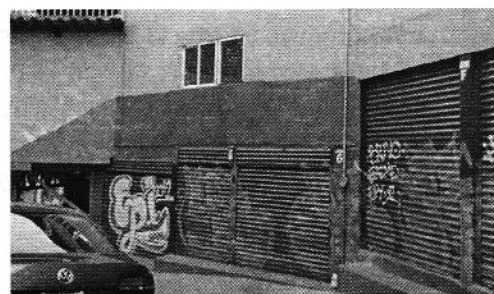
Fotografía 2. Se muestra sitio donde se encontraba el establecimiento mercantil en comento.

En ese sentido, se solicitó a la Dirección de Estudios y Dictámenes de Protección Ambiental de esta Entidad, que llevara a cabo estudio de emisiones sonoras en los puntos de denuncia, previa cita con las personas denunciantes; sin embargo, dicha Dirección informó que los estudios no se realizaron toda vez que las personas denunciantes señalaron que el establecimiento denominado “XTABAY” ya no se encontraba en funcionamiento, debido a que éste había sido clausurado. Asimismo, durante una nueva visita de reconocimiento de hechos, personal de esta Entidad se entrevistó con una persona trabajadora de uno de los locales del predio en comento, quien informó que dicho establecimiento había dejado de funcionar desde hace varios meses.