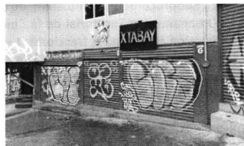
Fotografía 1. Se muestra fachada del establecimiento mercantil en comento.

En este sentido, personal de esta Subprocuraduría realizó tres visitas de reconocimientos de hechos de acuerdo a lo establecido en el artículo 15 BIS 4 fracción IV de la Ley Orgánica de esta Entidad, en las cuales se constató un inmueble de tres niveles de altura sobre nivel de banqueta con diversos locales comerciales, uno de los cuales exhibía un anuncio denominativo en su fachada con la leyenda "XTABAY", asimismo, durante una de las diligencias se constató el funcionamiento del establecimiento en comento, percibiéndose emisiones sonoras generadas por música grabada susceptibles de medición acústica.