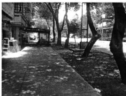
Fotografía 3. Imagen del sitio motivo de denuncia.

En seguimiento a la diligencia anterior se realizó un segundo reconocimiento de hechos el doce de junio del año en curso, donde se constató que se llevó a cabo el retiro de la estructura de metal; así como el cemento y pasto sintético o alfombra colocados en el área verde motivo de denuncia liberando el espacio de cualquier elemento ajeno a este; en dicho acto se tuvo comunicación con una persona del sexo masculino quien dijo ser propietario del establecimiento, mismo que señaló que días atrás personal de la Alcaldía Benito Juárez llevó a cabo el retiro del cemento vertido en la jardinera, no obstante lo anterior, se notificó el citatorio para que se presentara a comparecer ante esta Entidad y manifestara lo que a su derecho correspondía, acto durante el cual señaló que ellos no afectaron el área verde pues les conviene que se tenga la jardinera en buen estado; sin embargo indicó que podía llevar a cabo el mejoramiento del área verde, previa autorización de la Alcaldía Benito Juárez. Por lo anterior y respecto al derribo de un individuo arbóreo en el sitio referido en el escrito de denuncia, no se constató la presencia de algún tocón.