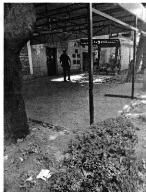
Fotografía 1 y 2. Imagen panorámica del sitio.

En seguimiento a la diligencia anterior se realizó un segundo reconocimiento de hechos el doce de junio del año en curso, donde se constató que se llevó a cabo el retiro de la estructura de metal; así como el cemento y pasto sintético o alfombra colocados en el área verde motivo de denuncia liberando el espacio de cualquier elemento ajeno a este; en dicho acto se tuvo comunicación con una persona del sexo masculino quien dijo ser propietario del establecimiento, mismo que señaló que días atrás personal de la Alcaldía Benito Juárez llevó a cabo el retiro del cemento vertido en la jardinera, no obstante lo anterior, se notificó el citatorio para que se presentara a comparecer ante esta Entidad y manifestara lo que a su derecho correspondía, acto durante el cual señaló que ellos no afectaron el área verde pues les conviene que se tenga la jardinera en buen estado; sin embargo indicó que podía llevar a cabo el mejoramiento del área verde, previa autorización de la Alcaldía Benito Juárez. Por lo anterior y respecto al derribo de un individuo arbóreo en el sitio referido en el escrito de denuncia, no se constató la presencia de algún tocón.