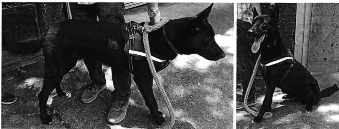
Fotografías 1 y 2. Se muestra ejemplar canino motivo de la presente investigación.