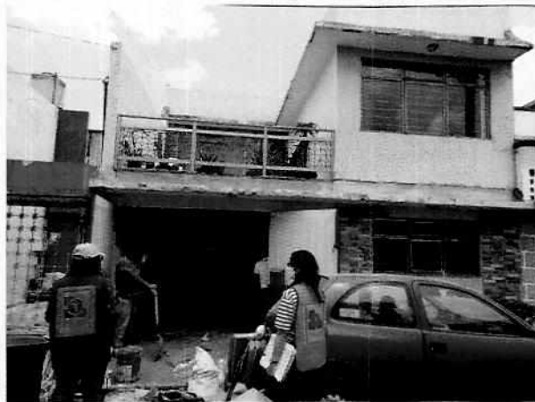
Fotografía 1. Lugar de los hechos denunciados.

En este sentido, de las constancias que obran en el presente expediente, se desprende que personal de esta Subprocuraduría llevó a cabo una visita de reconocimiento de hechos, de acuerdo a lo establecido en el artículo 15 BIS 4 fracción IV de la Ley Orgánica de esta Entidad, diligencia durante la cual una persona habitante del lugar donde se denunciaron los hechos objeto de la presente investigación, hizo de conocimiento al personal adscrito a esta Subprocuraduría que en su inmueble no tienen ejemplares felinos, en dicho acto el personal actuante no constató la presencia del ejemplar felino con las características descritas en la denuncia, al interior del domicilio en cuestión, toda vez que no se detectaron sonidos u olores característicos de dichos animales.