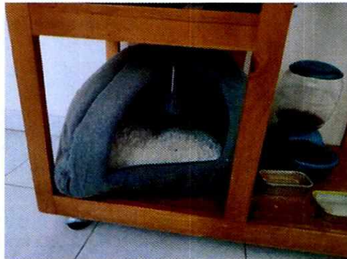
Figuras 1 y 2. Ejemplar denunciado y objetos utilizados por el mismo.

Es de resaltar que, en el Acuerdo de Admisión, que fue enviado por correo electrónico a la persona denunciante, se le hizo de conocimiento que contaba con un término de seis días hábiles para aportar las pruebas que estimara pertinentes en la investigación de los hechos, lo anterior conforme al artículo 90 del Reglamento de la Ley Orgánica de la Procuraduría Ambiental y del Ordenamiento Territorial de la Ciudad de México; sin embargo durante el procedimiento de investigación, no fueron proporcionados elementos de prueba que pudieran determinar incumplimiento a la normatividad en materia de bienestar animal.