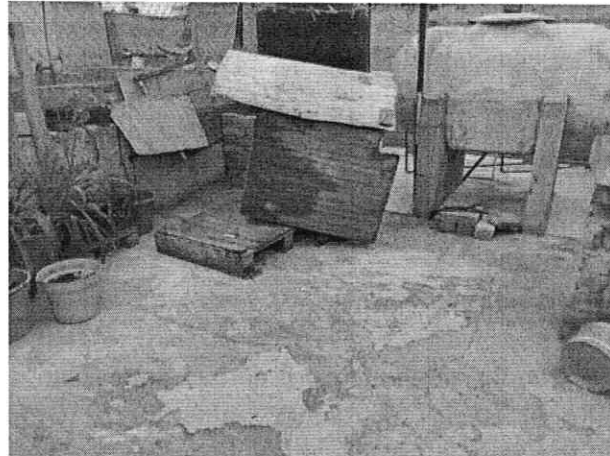
Imágenes 1 y 2. Se muestra fachada del inmueble así como azotea donde se encontraban los ejemplares caninos en comento

Cabe destacar que, con el propósito de contar con información adicional respecto de los hechos denunciados, en el Acuerdo de Admisión, que fue enviado por correo electrónico a la persona denunciante, se le hizo de conocimiento que contaba con un término de seis días hábiles para aportar las pruebas que estimara pertinentes en la investigación de los hechos, lo anterior conforme al artículo 90 del Reglamento de la Ley Orgánica de la Procuraduría Ambiental y del Ordenamiento Territorial de la Ciudad de México; sin embargo durante el procedimiento de investigación, no fueron proporcionados elementos de prueba que pudieran determinar incumplimiento a la normatividad en materia de bienestar animal.