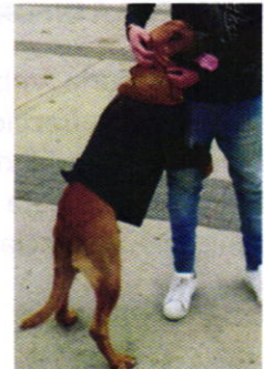
Fotografías 1-4.- Muestra a los ejemplares caninos motivo de denuncia "Jack" y "Canelo", así como al sitio de alojamiento y recipientes con croquetas y agua.

Es de resaltar que, en el Acuerdo de Admisión, que fue enviado por correo electrónico a la persona denunciante, se le hizo de conocimiento que contaba con un término de seis días hábiles para aportar las pruebas que estimara pertinentes en la investigación de los hechos, lo anterior conforme al artículo 90 del Reglamento de la Ley Orgánica de la Procuraduría Ambiental y del Ordenamiento Territorial de la Ciudad de México; sin embargo durante el procedimiento de investigación, no fueron proporcionados elementos de prueba que pudieran determinar incumplimiento a la normatividad en materia de bienestar animal.