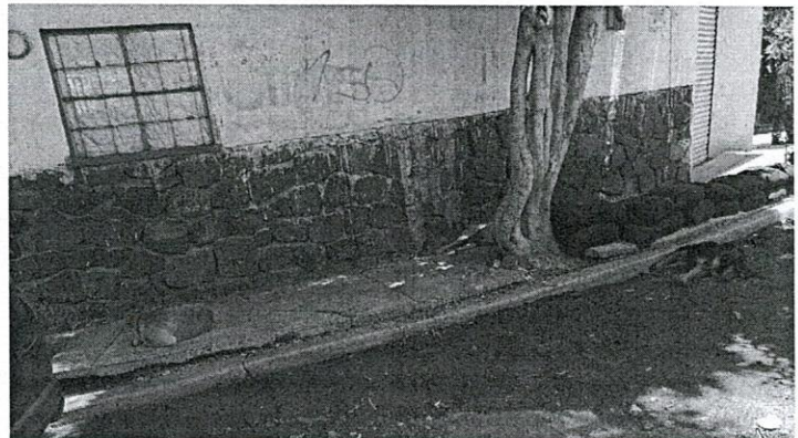
Figuras 1 y 2. Sitio motivo de denuncia.