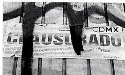
Fotografías 1 y 2: Fachada del sitio motivo de la denuncia.

Adicionalmente, por lo que hace a los hechos denunciados, se percibieron las emisiones sonoras provenientes por las actividades generadas en el interior del predio en comento, por lo que se desprende que el establecimiento sigue en funcionamiento, a pesar de contar con sellos de clausura por parte de dicho Instituto de Verificación.