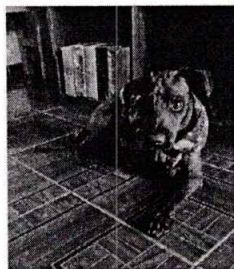
Fotografía 1.- En la imagen se observa al canino motivo de denuncia.

En seguimiento a la denuncia, la persona responsable del canino motivo de denuncia, estableció comunicación con personal de esta Entidad y mediante aplicación instantánea para teléfonos inteligentes envió imágenes fotográficas de las condiciones de bienestar animal que brinda a su animal de compañía, los cuales se aprecian que cuenta con agua y croquetas, tienen una condición corporal ideal, tienen una casa para perro que los protege contra la intemperie, se encuentran libres en el patio y cuentan con su cartilla de vacunación respectiva.