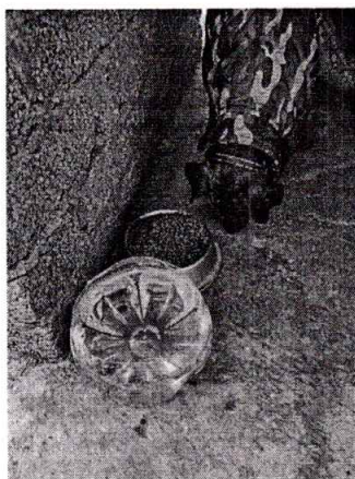
Fotografía 3.- Se observan los recipientes con agua y comida.

Es de resaltar que, en el Acuerdo de Admisión, que fue enviado por correo electrónico a la persona denunciante, se le hizo de conocimiento que contaba con un término de seis días hábiles para aportar las pruebas que estimara pertinentes en la investigación de los hechos, lo anterior conforme al artículo 90 del Reglamento de la Ley Orgánica de la Procuraduría Ambiental y del Ordenamiento Territorial de la Ciudad de México; sin embargo durante el procedimiento de investigación, no fueron proporcionados elementos de prueba que pudieran determinar incumplimiento a la normatividad en materia de bienestar animal.