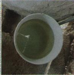
Fotografía 1.- Se observa el agua limpia que se les brinda.