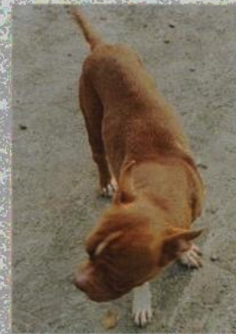
Fotografía 4.- Se observa el canino denominado "Balu".

Es de resaltar que, en el Acuerdo de Admisión, que fue enviado por correo electrónico a la persona denunciante, se le hizo de conocimiento que contaba con un término de seis días hábiles para aportar las pruebas que estimara pertinentes en la investigación de los hechos, lo anterior conforme al artículo 90 del Reglamento de la Ley Orgánica de la Procuraduría Ambiental y del Ordenamiento Territorial de la Ciudad de México; sin embargo durante el procedimiento de investigación, no fueron proporcionados elementos de prueba que pudieran determinar incumplimiento a la normatividad en materia de bienestar animal.