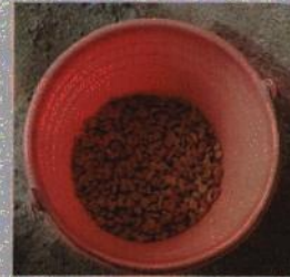
Fotografía 2.- Se observa el alimento que se les proporciona.