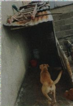
Fotografía 3.- Se observa al canino denominado "Beika" y su lugar de alojamiento limpio.