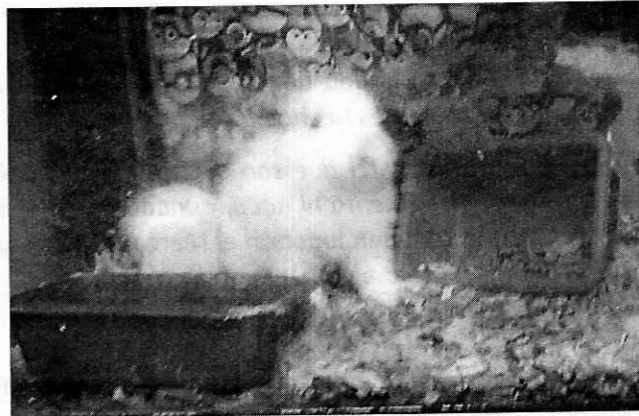
Fotografías 1 y 2. Vista de los canarios y los roedores puestos en venta en el sitio motivo de denuncia.

Por lo anterior, mediante oficio, se solicitó a la persona denunciante proporcionara mayor información respecto de los hechos denunciados; no obstante lo anterior, a la fecha de emisión de la presente, no se cuenta con elementos adicionales que permitan constatar los hechos de maltrato que motivaron la denuncia.